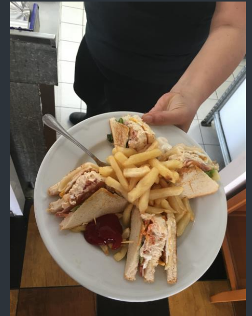
Americano sandwich con papas fritas