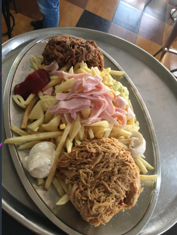
Papas fritas pollo mechado y jamon