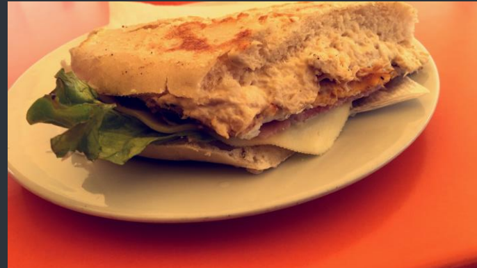
Bocadillo pollo especial